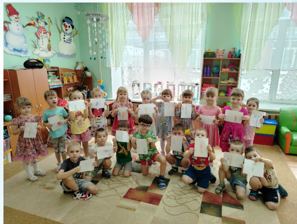
Рисование "Зубная щетка для мальчика Пети"