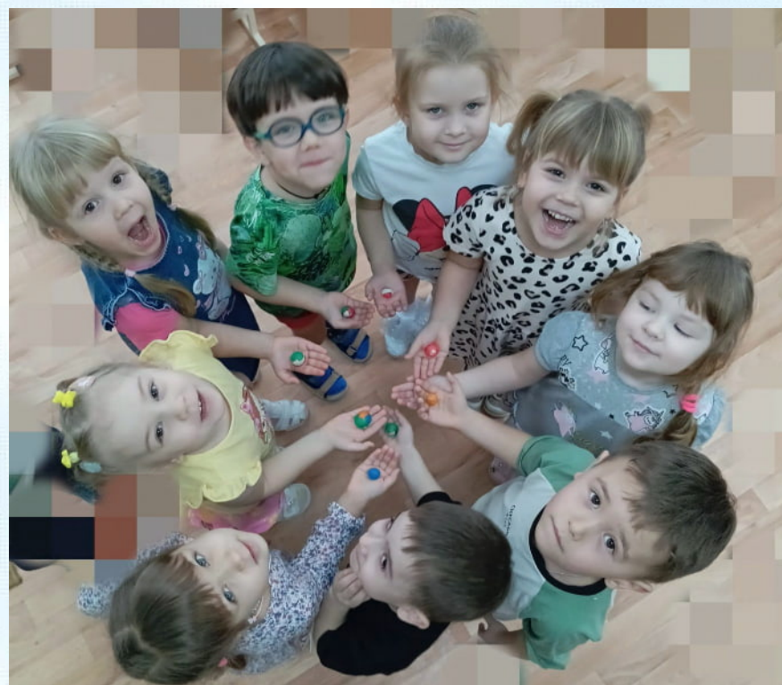
Лепка "Мячик – главный наш спортсмен"